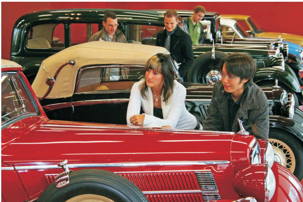
Im FORUM MOBILE

Zwickau, eine der drei Städte in Deutschland, in denen seit mehr als 100 Jahren durchgängig Automobile gebaut werden, begeht in diesem Jahr erneut ein bedeutendes Jubiläum. Zum 100. Male jährt sich am 16.07.2009 der Gründungstag der Firma AUDI durch August Horch (auch wenn der Name „AUDI“ erst ab dem 25.04.1910 rechtswirksam wurde). Diesem Jubiläum widmet die WHZ das diesjährige Oldtimertreffen.