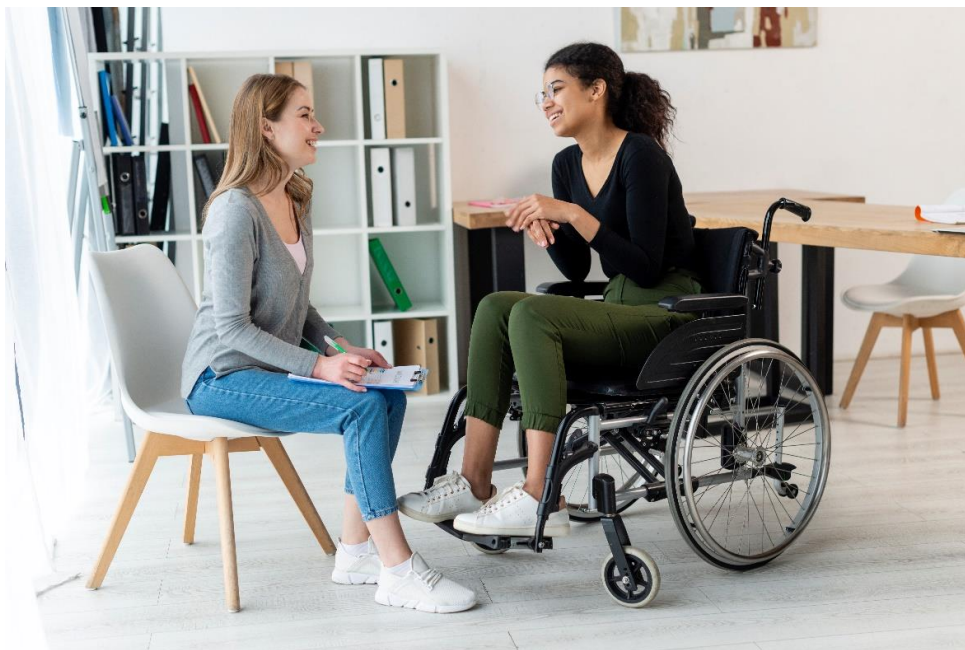
Foto: Eine Studienberaterin berät eine Studierende im Rollstuhl