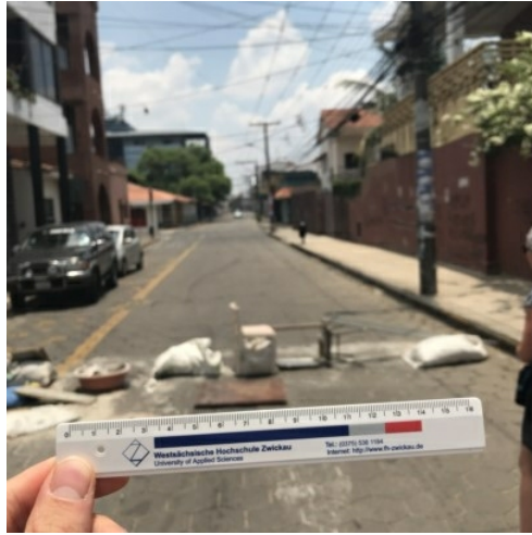
1. Platz, Bolivien, Jasmin Ludwigkeit